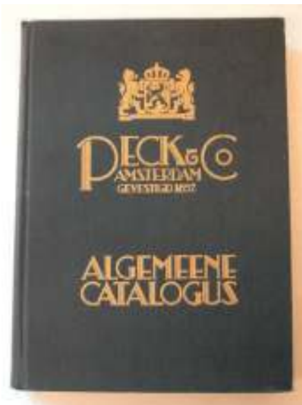
Badkamers van de firma Peck & Co.