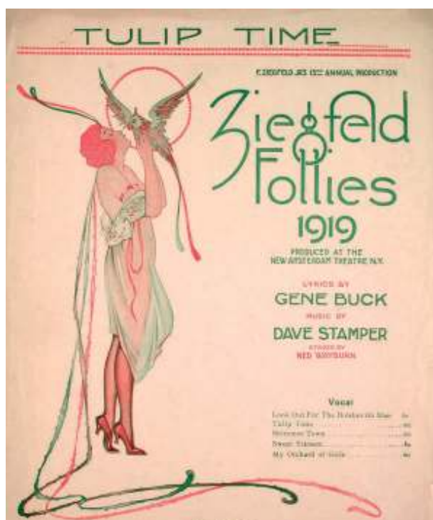
The Ziegfeld Follies