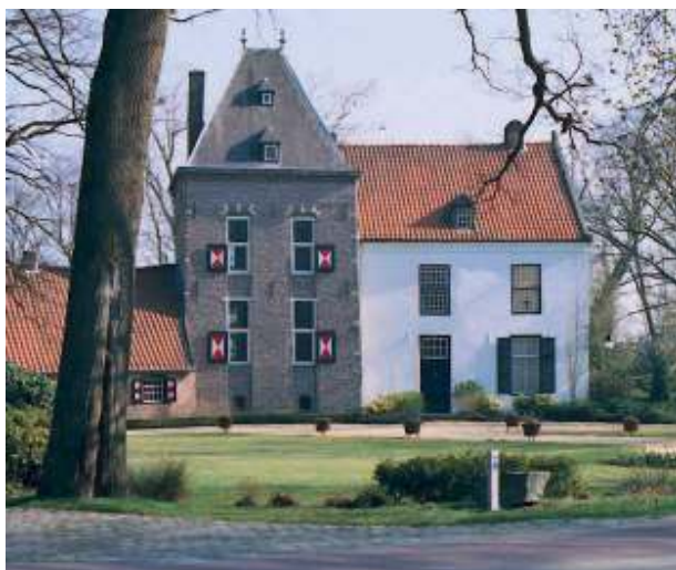
Kasteel Deurne van Boetzelaer.