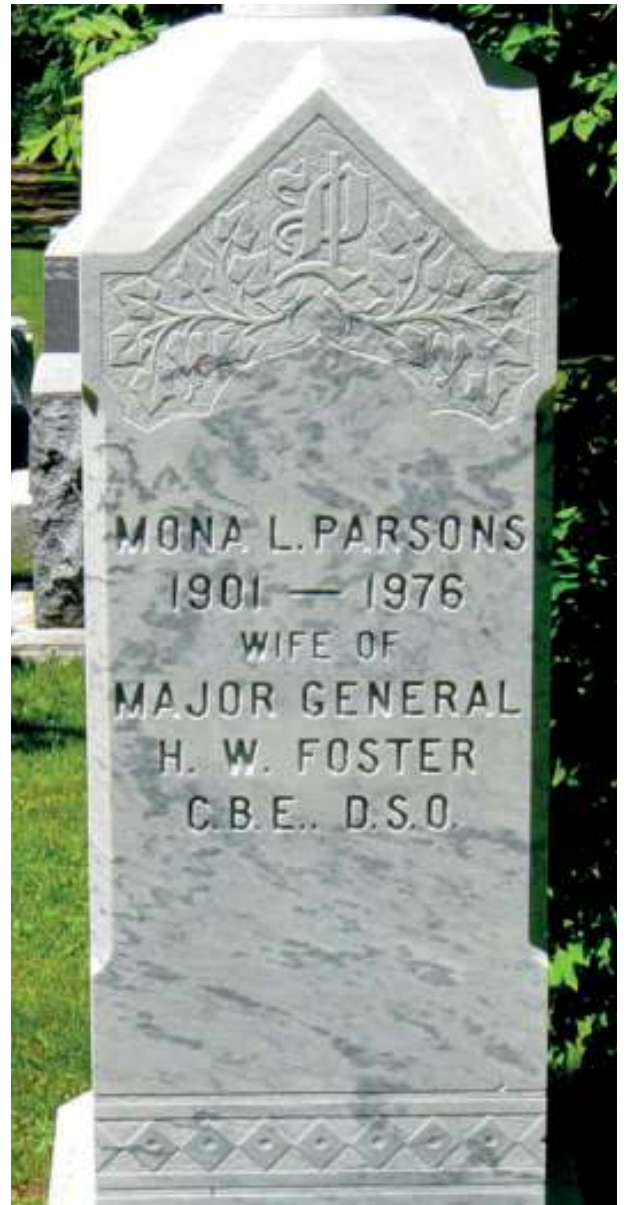
Graf van Mona in Canada.