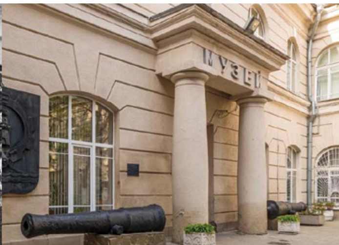
Maquette van kamp Sobibor in het historisch museum van Rostov.