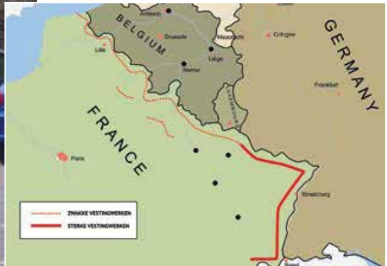
Maginotlinie als Franse verdediging tegen Duitse aanvallen.