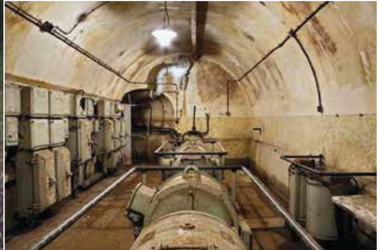
Transformatoren om elektriciteit voor het ondergrondse fort Michelsberg op te wekken.