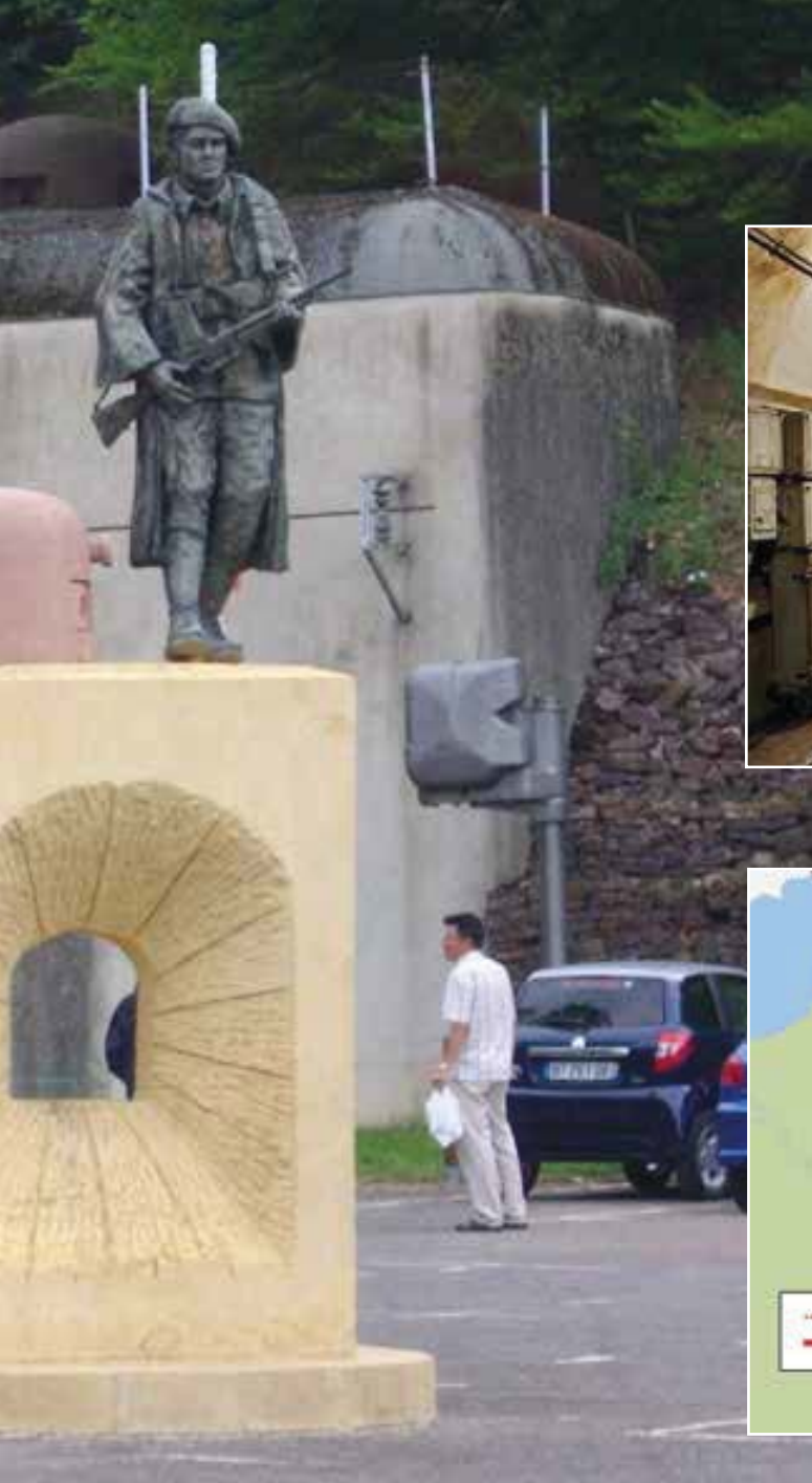
Hackenberg, een van de grote forten uit de Maginotlinie, thans museum.