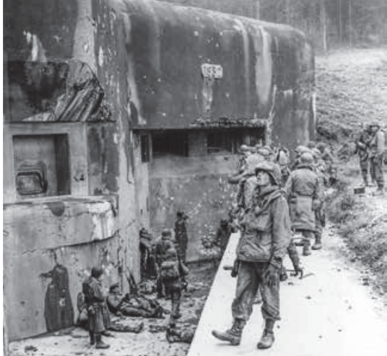
December 1944: Amerikanen moeten het opnemen tegen Hitlers troepen die de Maginotlinie hebben bezet.

De Maginotlinie liep nog langs de grens met Luxemburg, maar nauwelijks langs de grens met België. Waarom niet? De Franse legerleiding ging er vanuit dat een Duitse aanval door de Ardennen met zijn bossen en diepe rivierdalen niet mogelijk was. Bovendien werd de Belgisch-Duitse grens bewaakt door het immense fort Eben-Emael, in totaal 150 voetbalvelden groot. Het bestreek het hele gebied tussen Maastricht en Luik. Het fort werd geacht de kracht van de Maginotlinie te overtreffen. Het zou de Duitse opmars door Belgisch Limburg en Vlaanderen lang genoeg kunnen tegenhouden om de inzet van voldoende Franse troepen mogelijk te maken. Beide veronderstellingen bleken onjuist. Duitse pantsergroepen wisten bliksemsnel door de Ardennen op te rukken en al spoedig vestingstad Sedan in Frankrijk te veroveren. De slag om fort Eben-Emael was dramatisch. Een aantal Duitse zweefvliegtuigen landde eenvoudig op het grote dak van het fort. Enkele tien-