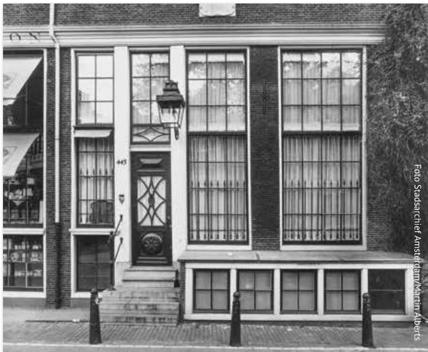
Singel 443 Amsterdam, in het souterrain had Eikeboom zijn boekhandel Mondain.

Ook na de Duitse inval bleef hij zijn boekwinkeltje voortzetten. Daarnaast schreef hij artikelen tegen de bezetter, die hij zelf stencilde, bundelde en niette. Hij verspreidde ze onder vrienden, kennissen en geestverwanten of hij gaf een stapeltje weg ter verspreiding. Helaas is de inhoud van al dit titelloze illegale drukwerk niet meer te achterha-