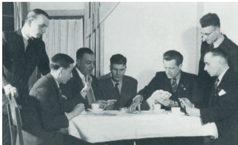
Het filiaal van Lippmann, Rosenthal & Co. in Westerbork (Beeldbank WO2-NIOD).

contant geld, cheques en banktegoeden moesten worden gestort op een rekening bij de 'roofbank' Lippmann, Rosenthal & Co. (Liro) in Amsterdam, waar ook alle effecten in depot moesten worden gegeven; onroerende goederen en daarop gegronde rechten (grondbezit, huizen en hypotheeken) van Joden werden onteigend; waardevolle verzamelingen, kunstvoorwerpen en voorwerpen van platina, goud en zilver (uitgezonderd 'gebitvullingen in persoonlijk gebruik') moesten worden ingeleverd; vorderingen op derden, inclusief afgesloten verzekeringen, moesten bij Liro worden aangemeld, waarna de polissen werden afgekocht en het geld verdween. Wat de Joden op weg naar de Duitse vernietigingskampen nog aan bezittingen hadden, werd hen in het doorgangskamp Westerbork door vertegenwoordigers van Liro afgenomen; wat zij