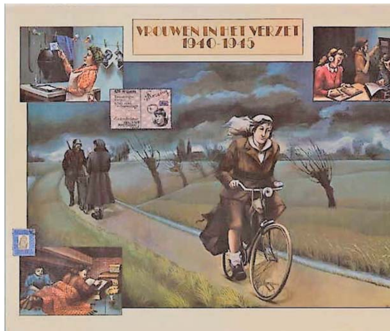
Schoolplaat vrouwen in het verzet (J. v.d. Wusten).

En hadden deze vrouwen wel een eigen verzetsintentie gehad? Vragen waarover de meningen zowel binnen de Stichting als tussen de Stichting en de BPR konden verschillen.