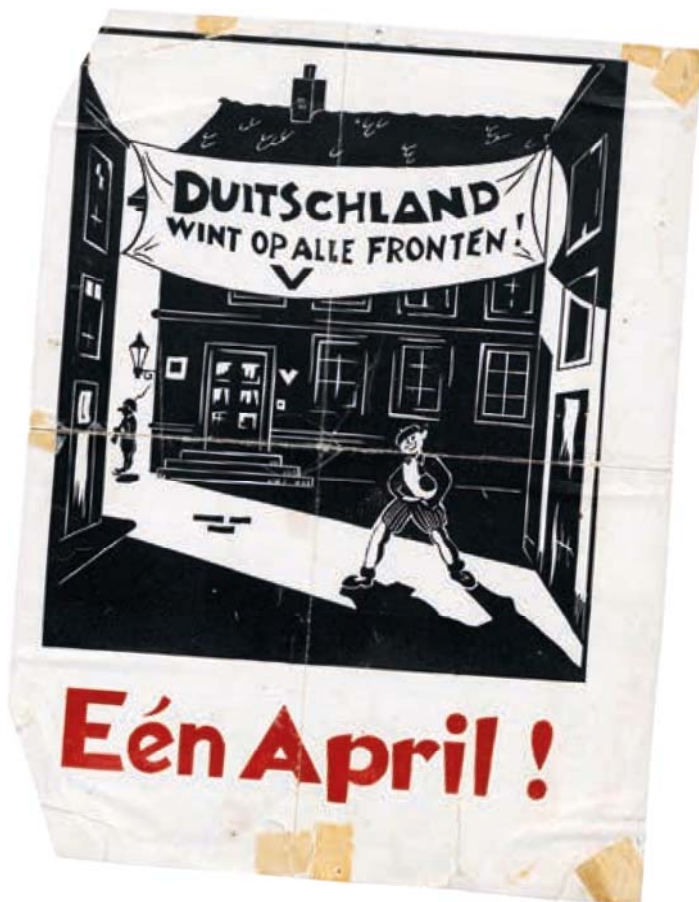
1 April. Duitsland wint op alle fronten.

In de jaren tachtig kwam er meer maatschappelijke aandacht voor vrouwen in het verzet. Dat resulteerde ook in meer Wbp-aanvragen door echtgenoten van al erkende verzetsdeelnemers. Hun aanvragen waren voer voor discussie: behelste hun verzet meer dan het verrichten van 'hand- en spandiensten' voor hun echtgenoten?