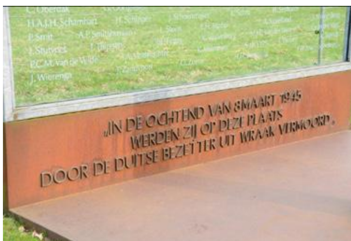
Woeste Hoeve, sprekend detail van het monument.

In de Betuwe werd 198 dagen onafgebroken gevochten, de helft van het gebied onder water gezet en werden 198 vliegtuigen neergeschoten. 60.000 burgers moesten evacueren. Een deel van