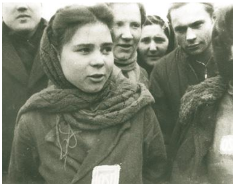
Bij Herkenbosch werden talrijke Russische vrouwen, die als dwangarbeidster waren ingezet, op gruwelijke wijze vermoord.