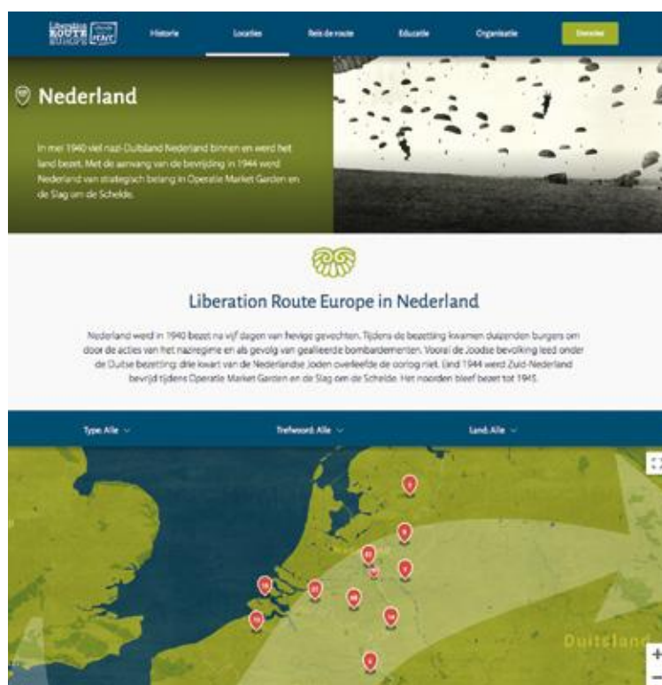
Informatieplekken in heel Nederland vindt u op de website liberationroute.nl

zware strijd in de Peel, de ontruiming van Limburg ten oosten van de Maas, waarbij 80.000 burgers gedwongen worden naar Friesland en Groningen te evacueren, de tankslag bij Overloon, de executie van tientallen onderduikers door fanatieke SS-ers: het heeft diepe sporen nagelaten in de Limburgse gemeenschap. Het is dan ook geen wonder dat de oproep van het provinciebestuur aan de bevolking om met initiatieven te komen voor de herdenking van 75 jaar bevrijding grote weerklank vond. Meer dan honderd voorstellen werden ingediend, kregen goedkeuring en een subsidie van 2 miljoen euro.