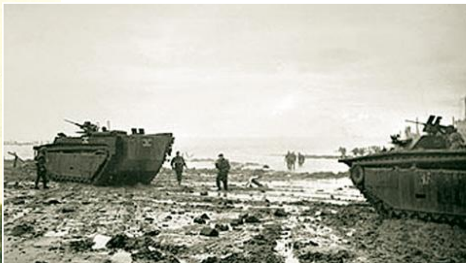
Engelsen landen op Walcheren.