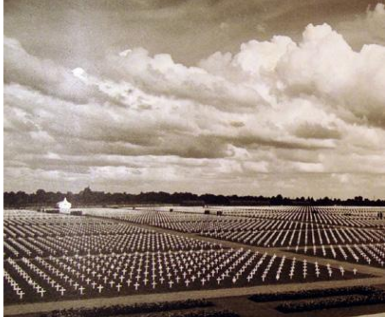
Amerikaanse oorlogsbegraafplaats Margraten.

De geallieerde troepen betraden in Zuid-Limburg voor het eerst Nederlands grondgebied. Op 12 september 1944 wordt het dorp Mesch, onder Maastricht, bevrijd. Twee dagen later bezetten de troepen Maastricht, de eerste stad die van de Duitsers verlost wordt. Binnen een week wordt heel Zuid-Limburg, op Kerkrade na, bevrijd. Op 20 september stopt de geallieerde opmars bij Susteren. De rest van de provincie verandert in een bloedig slagveld waar pas op 3 maart 1945 een einde aan komt. De