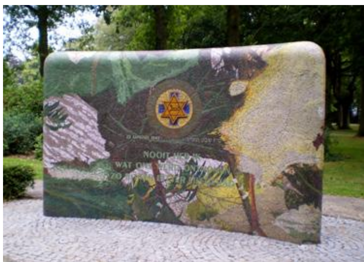
Apeldoornse Bos, monument ter herdenking van weggevoerde Joodse patiënten.

de evacués werd naar door Duitsers bezet gebied afgevoerd, een ander deel naar door geallieerden bevrijd gebied. Een beperkt aantal mannen bleef achter om de boerderijen te bewaken.