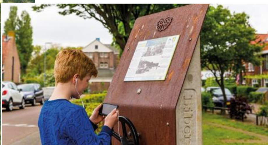
Luisterplek van de Liberation Route.