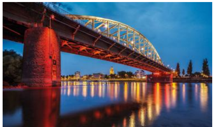
Lichtshow bij de John Frostbrug in Arnhem.

In september is er een omvangrijke luchtshow met honderden parachutisten die op de Ginkelse Heide neerkomen, Wings of Freedom. In Arnhem zal bij de John Frostbrug een spectaculaire lichtshow worden opgevoerd onder de titel Bridge to the Liberation Experience. Het Gelders Orkest zal naast het War Requiem ook de Arnhemse Psalm uitvoeren. Er is speciale aandacht voor de Poolse para's in Driel. Zij hebben het door hun standvastigheid mogelijk gemaakt dat honderden Britse para's konden