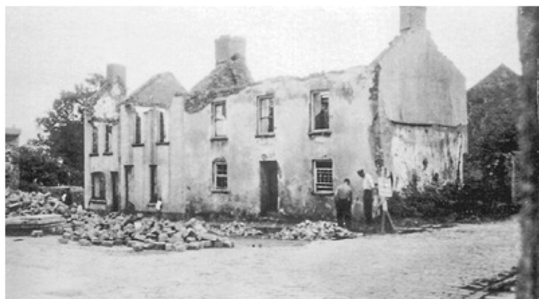
Zo troffen veel bewoners hun huis aan bij terugkeer.