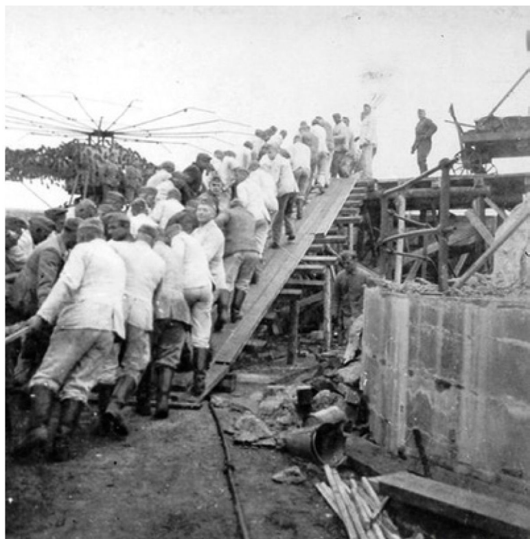
Dwangarbeiders van Organisation Todt.

vroegen velen zich af wie die kolossale bunkers op hun eiland hadden gebouwd. En van wie waren de 400 graven, bijeengebracht in een kleine begraafplaats? En wat betekenden die stenen toegangspoorten, los in het landschap. Langzamerhand kwam het beeld van verschrikkelijke dwangarbeid naar voren.