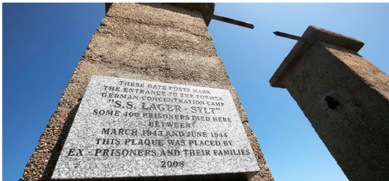
Rest van de toegangspoort van het SS-kamp Sylt.