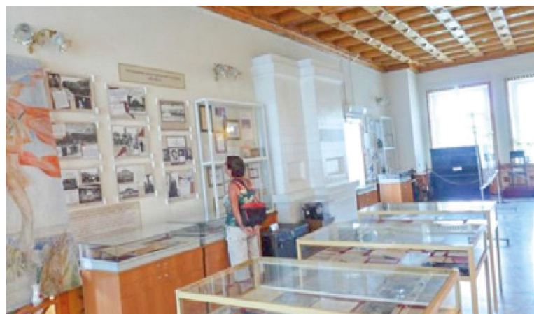
Museum in Sylt.

rijke publicaties ver uiteen. Ter plekke werden 400 doden geteld, Joodse organisaties spreken van 10.000 slachtoffers en er zijn publicaties die over 70.000 slachtoffers spreken.