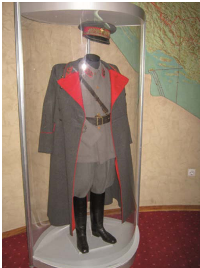
Bij de vlucht langs de touwladder moest Tito zijn uniform achter laten. Het werd buitgemaakt door Duitsers, een schrale troost.

Kaart van Joegoslavië waarop operatie Rösselsprung met de Duitse troepenbewegingen in blauw en de partizanen in rood aangegeven.