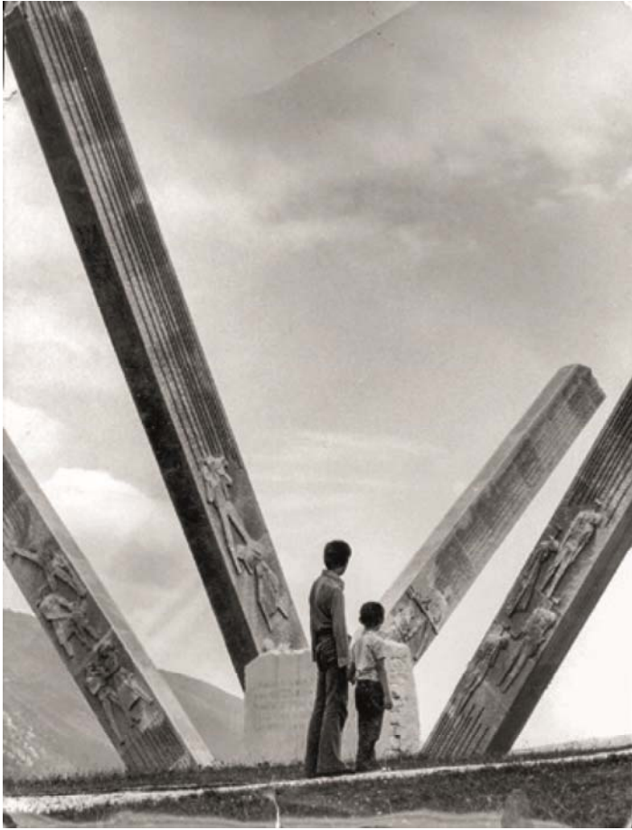
Monument voor de slag bij Dvřar.