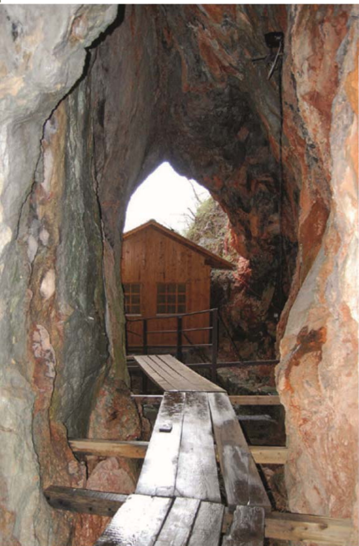
Toegang tot de grot bij Dvřar.