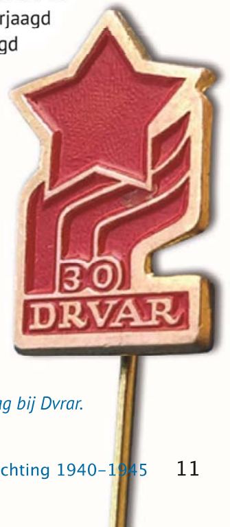
Speldje ter herinnering aan de slag bij Dvřar.

Met een draagbare zender werd contact opgenomen met het Engelse bezettingsleger in Italië. Er werd snel en doeltreffend ingegrepen. Op 3 juni landden bij Kupres kort na elkaar zes Douglas transportvliegtuigen. Het hele hoofdkwartier van Tito, 118 gewonde partizanen en buitenlandse helpers, werd overgevlogen naar het Italiaanse Bari. Drie dagen later werden de Joegoslaven op een oorlogsschip overgebracht naar het Dalmatische eiland Vis, dat veilig en ver in de Adriatische Zee lag. Onbereikbaar voor Duitse strijdkrachten. Op dat eiland bevond zich een ruime, diepe grot van waaruit de generale staf van Tito de partizanenoorlog kon voortzetten. Zijn leger had inmiddels een omvang van 300.000 geoefende strijders, in divisies en regimenten onderverdeeld. De slagkracht ervan kwam ook tot uitdrukking in de boodschap die het Duitse Balkan-commando aan Hitler telegrafeerde: 'Wij kunnen niet langer spreken van een oorlog tegen bandieten, maar hebben met een ordelijk en getraind leger te maken'. Het zijn uiteindelijk de partizanen geweest die de Duitse troepen uit Joegoslavië verjaagd en tot ver in Oostenrijk achtervolgd hebben. Daarbij gesteund door het Sovjet-leger en Engelse bommenwerpers. Maar Rösselsprung is altijd een essentieel onderdeel van de bevrijdingsoorlog gebleven. De operatie leeft voort in tientallen boeken, militaire studies, films en monumenten en wordt tot op de dag van vandaag ieder jaar herdacht.