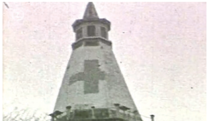
Het oude dorpje Groede was de verblijfplaats van de dichter Vader Cats. Het bleef voor oorlogsgeweld grotendeels gespaard, want er was een grote Rode Kruis-post gevestigd. Dat werd door alle partijen gerespecteerd.

zijn, waarin lange afstand geschut, commando-post, hospitaal en voedselopslag waren ondergebracht. De metersdikke muren waren voorzien van