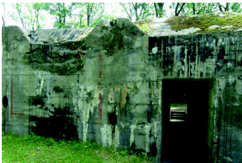
Bunkers uit het bunkerdorp Groede, zoals het er nu bij ligt.