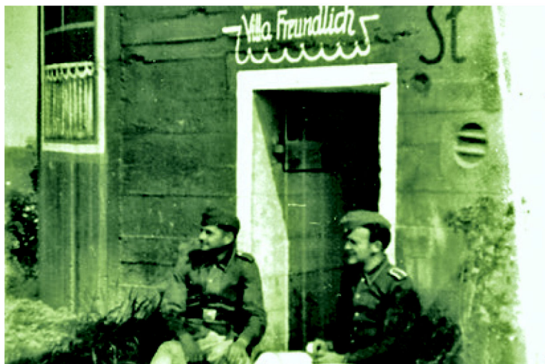
Thans is dit een oorlogsmemorial over Switchback