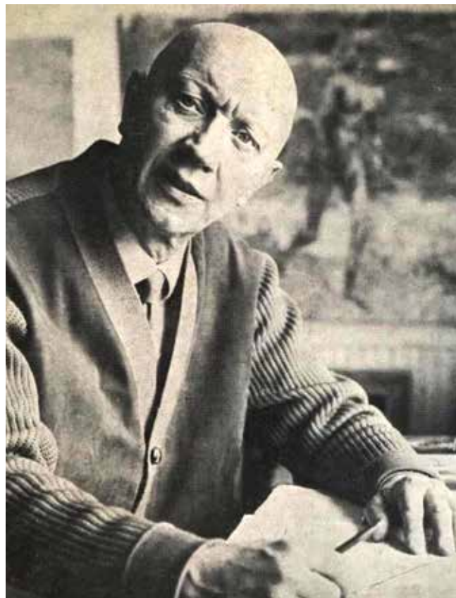
Dick Bos 9-12, Arbeiderspers, Amsterdam 1972